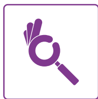
Meranie kvality siete